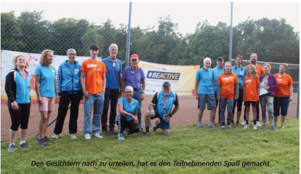
Den Gesichtern nach zu urteilen, hat es den Teilnehmenden Spaß gemacht