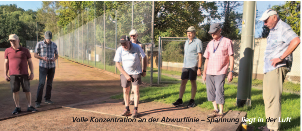
Volle Konzentration an der Abwurfslinie – Spannung liegt in der Luft