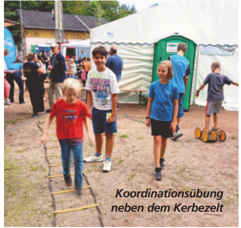
Koordinationsübung neben dem Kerbezelt