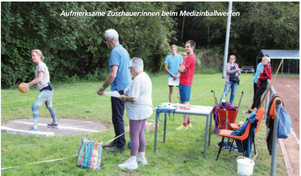
Aufmerksame Zuschauer:innen beim Medizinballwerfen

Einziger Wermutstropfen des Abends: Eine Teilnehmerin zog sich unmittelbar beim Start zum Sprint einen Riss der Achillessehne zu und muss nun leider einige Zeit mit dem Sport pausieren, kann aber hoffentlich die noch fehlende Übung bis zum Jahresende nachholen. Wir wünschen auf diesem Wege gute Genesung!