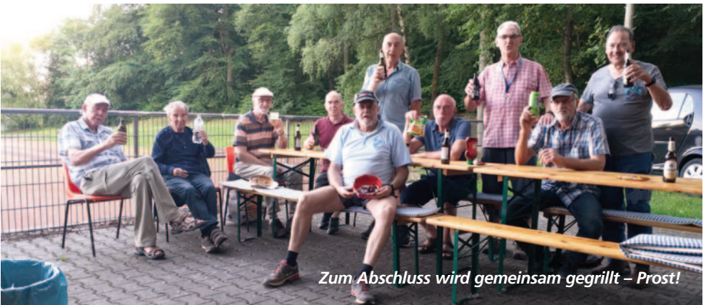
Zum Abschluss wird gemeinsam gegrillt – Prost!