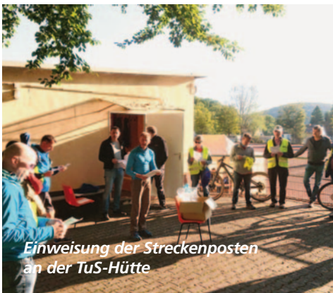
Einweisung der Streckenposten an der TuS-Hütte

Als „Finisher“-Präsent gab es dieses Jahr direkt nach dem Zieleinlauf praktische Tassen mit dem TuS Rambach-Logo, die glücklicherweise am Freitag vor dem Lauf noch „auf den letzten Drücker“ angeliefert worden waren.