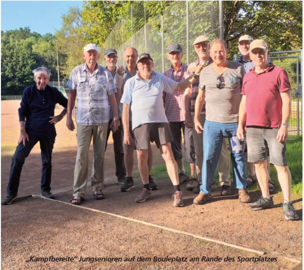
„Kampfbereite“ Jungsenioren auf dem Bouleplatz am Rande des Sportplatzes