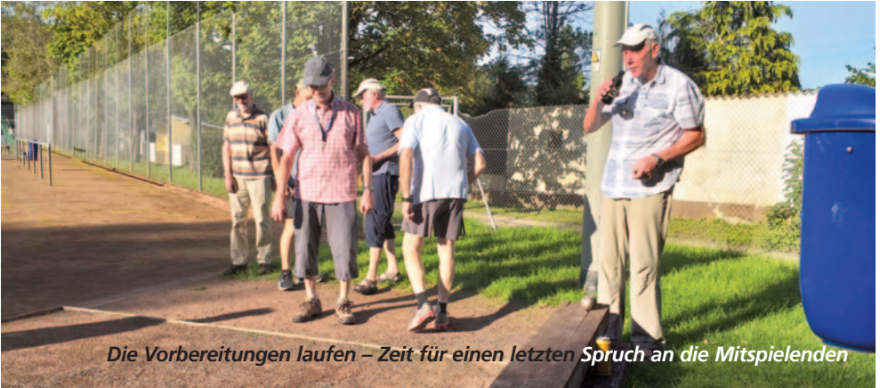
Die Vorbereitungen laufen – Zeit für einen letzten Spruch an die Mitspielenden