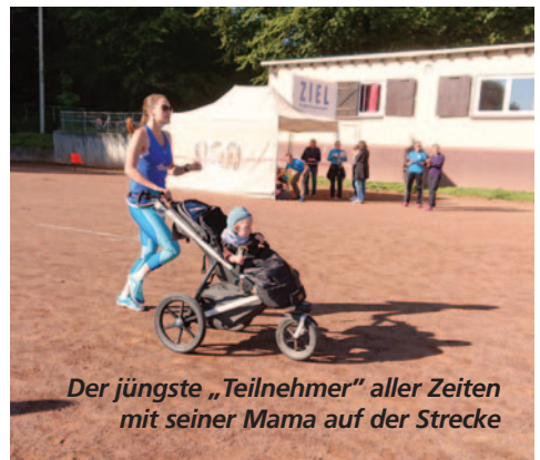
Der jüngste „Teilnehmer“ aller Zeiten mit seiner Mama auf der Strecke