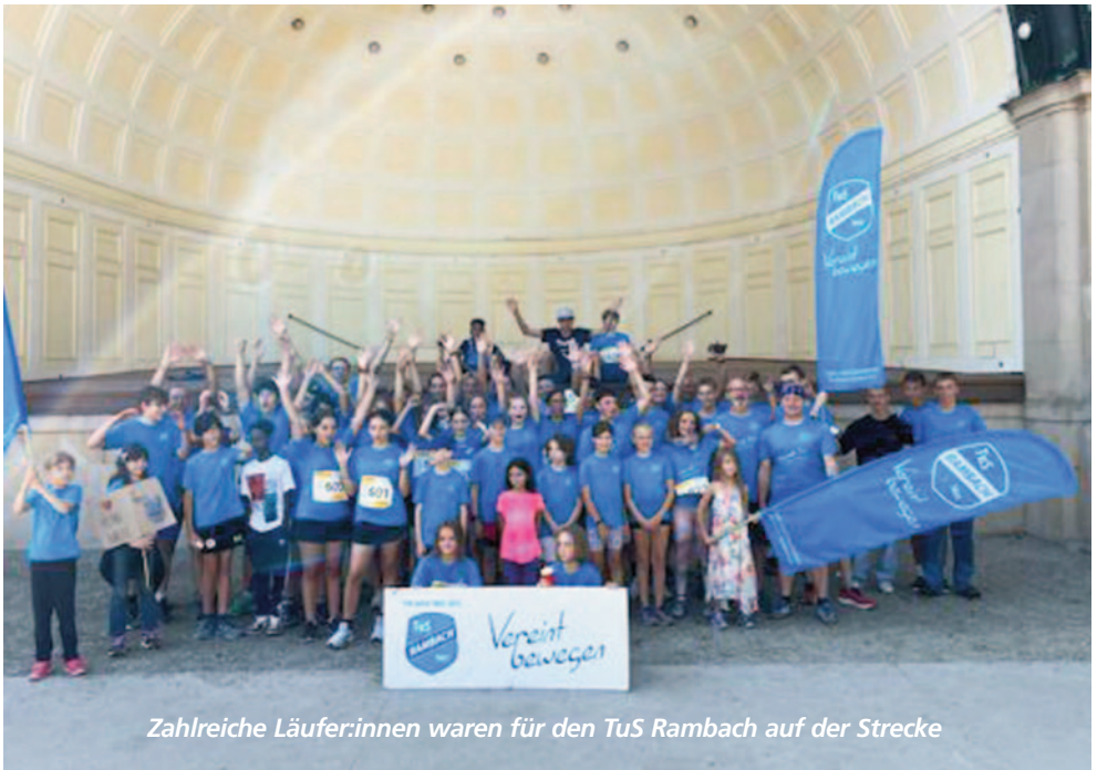
Zahlreiche Läufer:innen waren für den TuS Rambach auf der Strecke