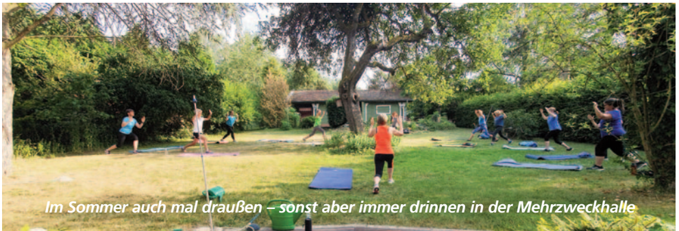
Im Sommer auch mal draußen – sonst aber immer drinnen in der Mehrzweckhalle

Es würde uns also freuen, euch an einem Dienstagabend bei uns in der Übungsstunde zu begrüßen.