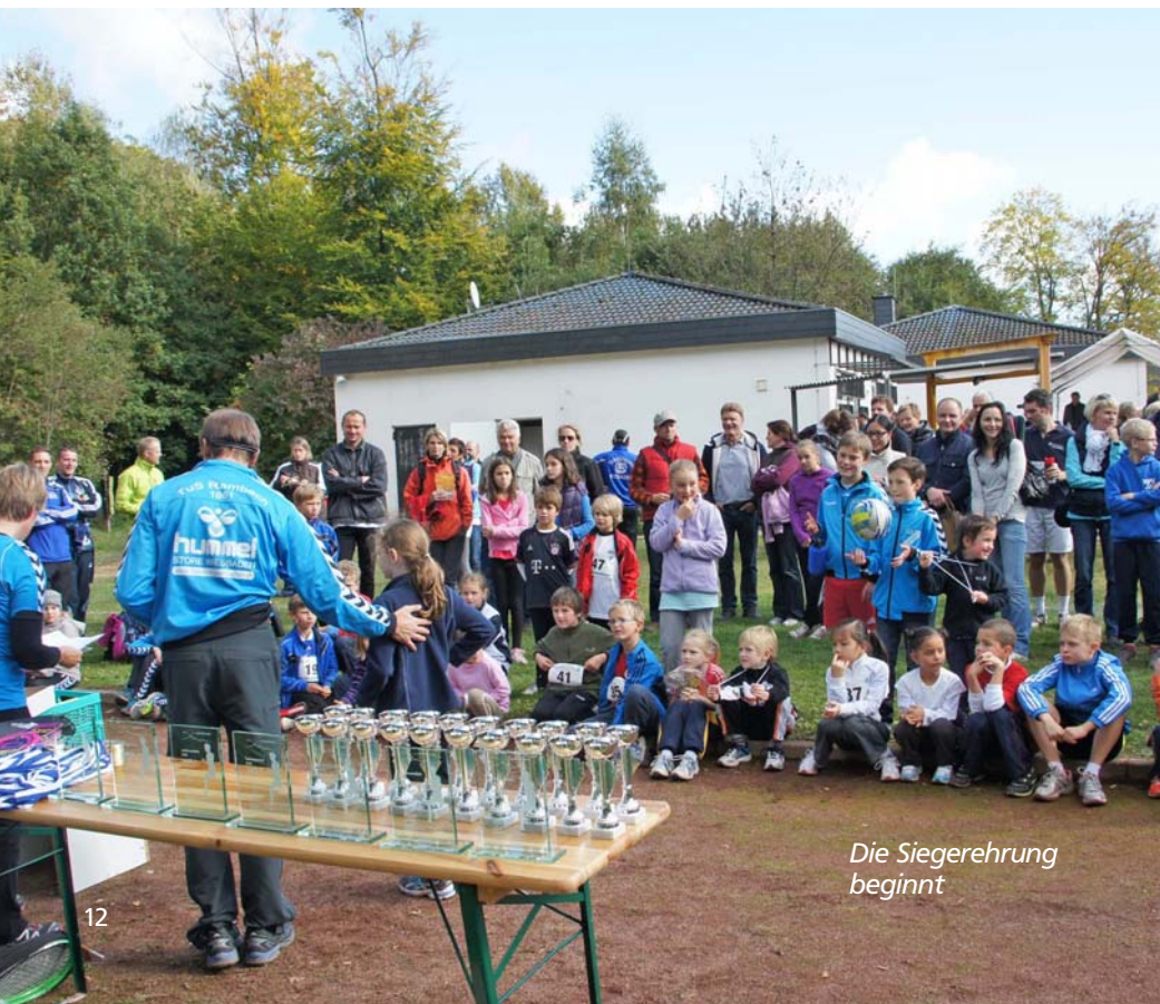
Die Siegerehrung beginnt