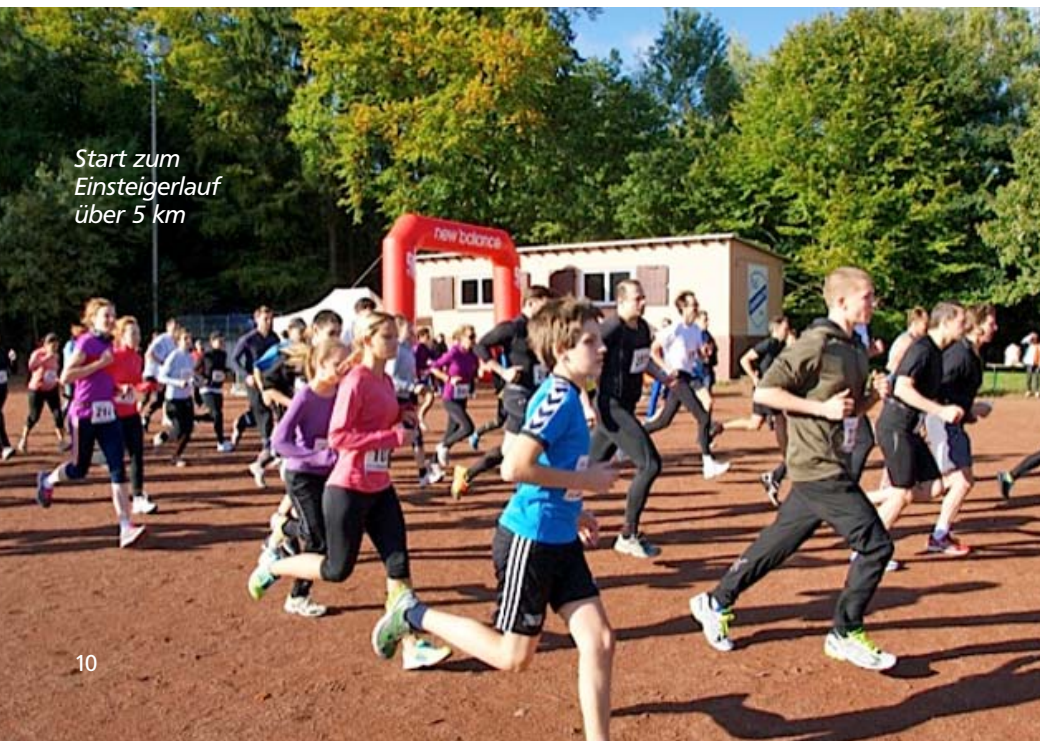
Start zum Einsteigerlauf über 5 km