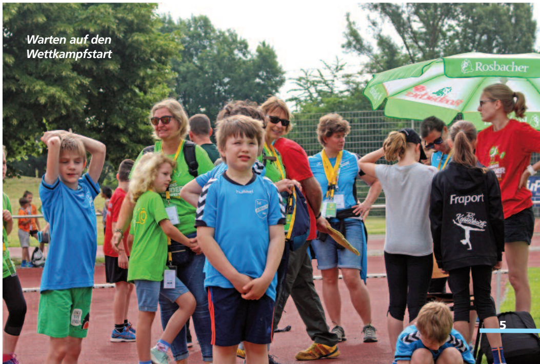
Warten auf den Wettkampfstart

Am Ende gab es noch eine große Überraschung, Knicklichter flogen in alle Richtungen. So ging an diesem Abend jedes Kind leuchtend und glücklich nach Hause.