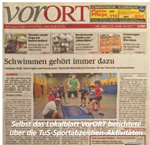
Selbst das Lokalblatt VorORT berichtete über die TuS-Sportabzeichen-Aktivitäten

Dank an alle Aktiven, die zu dieser Leistung des TuS beigetragen haben.