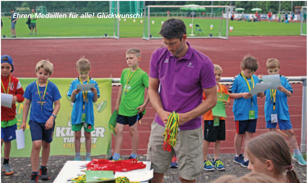
Ehren-Medailles für alle! Glückwunsch!

Am nächsten Morgen hieß es dann wieder alles einpacken und in die Autos verstauen. Anschließend haben wir uns wieder auf der Wieseck-Aue eingefunden. Manche schiefen noch ein bisschen, andere haben die verschiedenen Turnfestangebote genutzt.