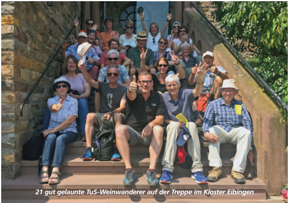
21 gut gelaunte TuS-Weinwanderer auf der Treppe im Kloster Eibingen