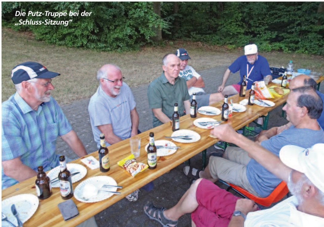
Die Putz-Truppe bei der „Schluss-Sitzung“