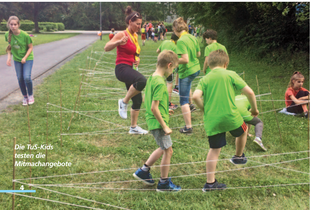
Die TuS-Kids testen die Mitmachangebote

Von dem obligatorischen Orientierungslauf und Turnspielparcour bis zur Glühwürmchen-Challenge war alles dabei.