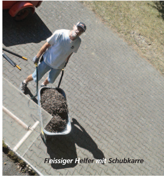
Fleissiger Helfer mit Schubkarre