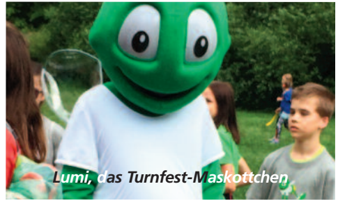
Lumi, das Turnfest-Maskottchen

Nach einer kurzen Schulinspektion haben wir uns direkt mit dem Bus auf zur Wieseck-Aue gemacht.